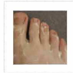
*מריחת קרם (אלסטריה)