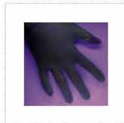
Allpresan® קרם קצף