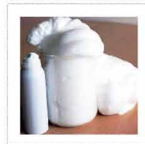
*Allpresan 125 מ"ל