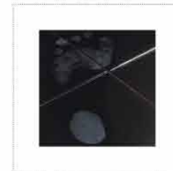
Allpresan® קרם קצף